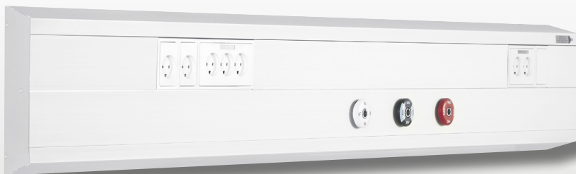
MediCLine 2000 - Vandret/lodret

Panelet er fremstillet i henhold til international standard med CE-certifikat og kan anvendes uden sikkerhedsmæssige risici for brugeren.