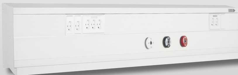
MediCLine 2001 - Med integreret kulisseskinne, vandret/lodret